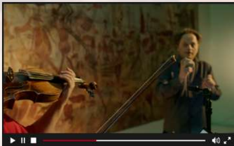
Sono Anima de Kryštof Mařatka par Kryštof Mařatka et Karine Lethiec